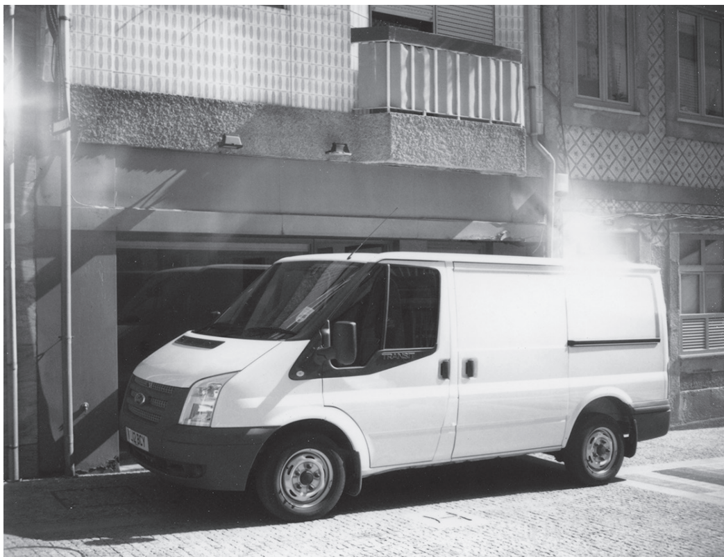
Merlin Carpenter, Untitled , 2012, utilitaire Ford Transit vide. Exposition collective «Port (Curated by Lindsay Jarvis)», Galeria Nuno Centeno, Porto, 2012.