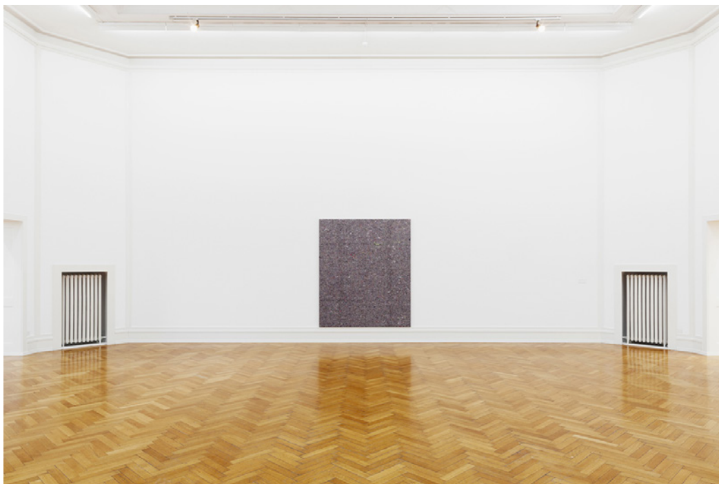
Merlin Carpenter, Midcareer Paintings , vue de l'installation, Kunsthalle Bern, Suisse, 2015.