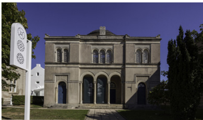
CAC - la synagogue de Delme.