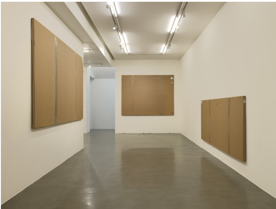
Merlin Carpenter, Do Not Open Until 2081 , vue de l'installation, Simon Lee Gallery, Londres, 2017.