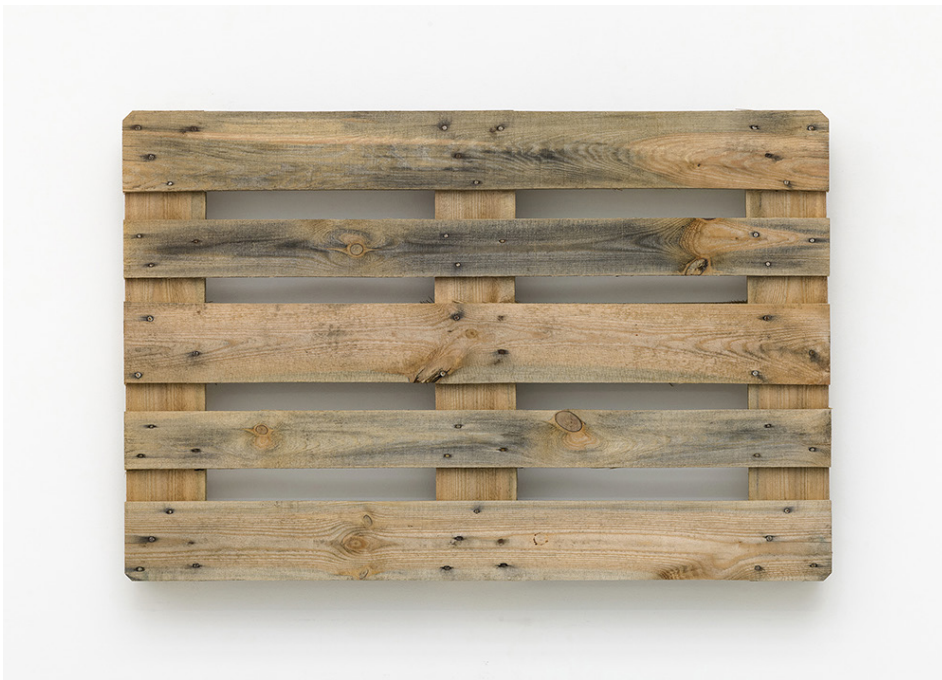
Merlin Carpenter, Long Title , 2017. Pallette en bois, 80 x 120 x 14.5 cm.

Visuels en haute-définition téléchargeables dans l'espace presse sur le site www.cac-synagoguedelme.org (identifiant et mot de passe sur demande). Des vues de l'exposition seront disponibles après le vernissage.