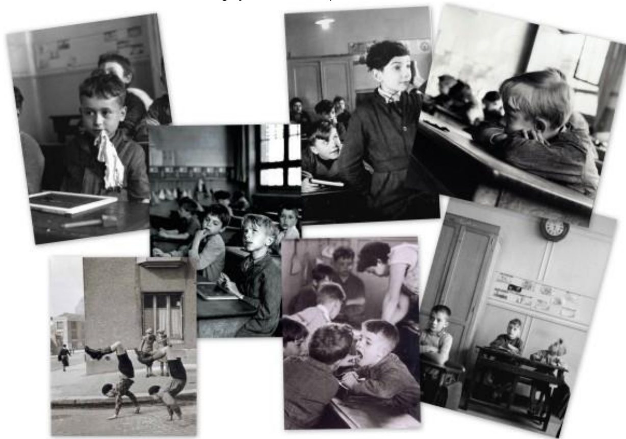
Les garçons et l'école vus par Robert Doisneau.

Il est tout aussi notable que la particularité seconde de ce spectacle tient au fait qu'il est joué in situ, dans les écoles, dans les bibliothèques ou tout autre lieu qui, à priori, ne relève pas d'une identité spectaculaire de théâtre. Il en résulte un épurement des décors, des accessoires, de tous les éléments iconographiques signifiants dans l'univers théâtral qui donne à la parole de l'acteur et à l'imaginaire du spectateur une puissance évocatrice singulière.