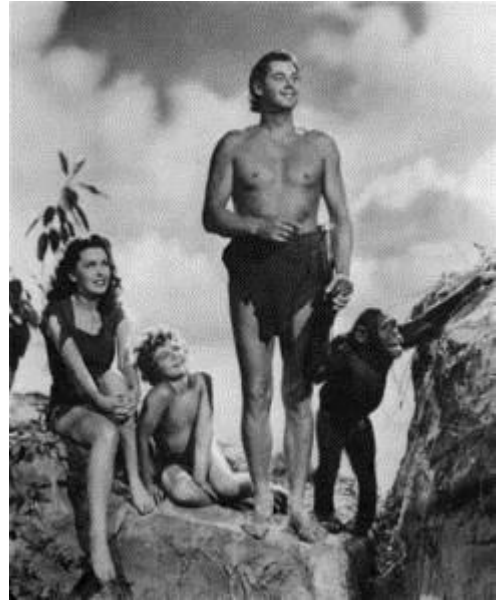
Tarzan l'homme singe, film de W.S Van Dyke, 1932

Il sera d'ailleurs fait par plusieurs fois référence à Tarzan dans la pièce tant parce qu'il est l'archétype du mâle essentiel que parce que son cri de guerre tétanise et méduse.