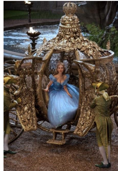
Cendrillon de Kenneth Branagh, 2015

Du prince, on sait en général peu de choses, si ce n'est qu'il doit être « charmant » (à quelques exceptions près), qu'il délivre la princesse et l'épouse.