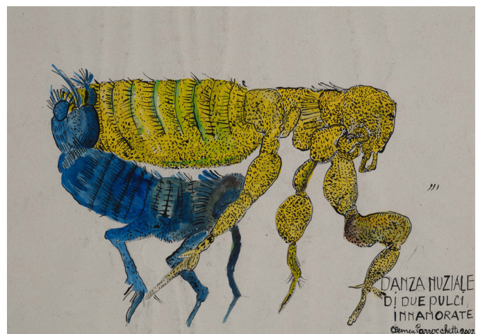
Clemen Parrocchetti, Danza nuziale di due pulci innamorate [Danse nuptiale de deux puces amoureuses], 2002.