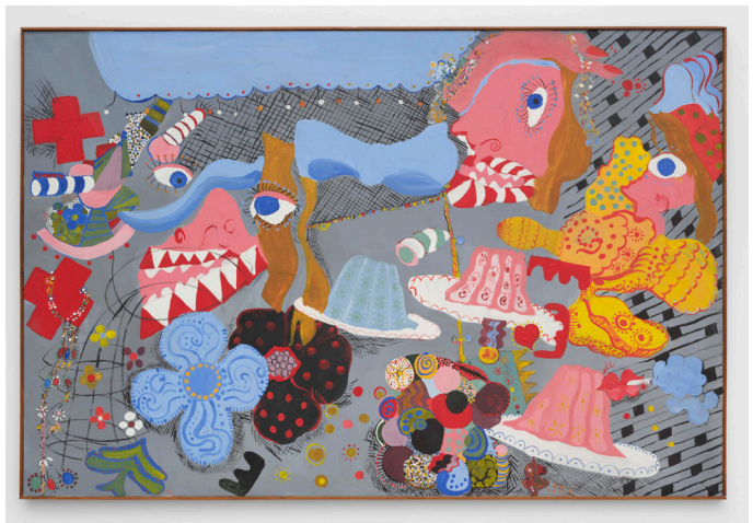
Clemen Parrocchetti, A proposito di un certo pranzo con croci, gioielli e fiori [À propos d'un certain déjeuner avec des croix, des bijoux et des fleurs], 1969.

En établissant un rapport à la nature qui dépasse les séparations entre humain et animal, nuisibles et alliés, Clemen Parrocchetti nous ouvre la voie pour repenser ces catégories et renégocier notre rapport avec l'environnement – et plus largement pour sortir des relations de domination entre genres ou entre espèces.