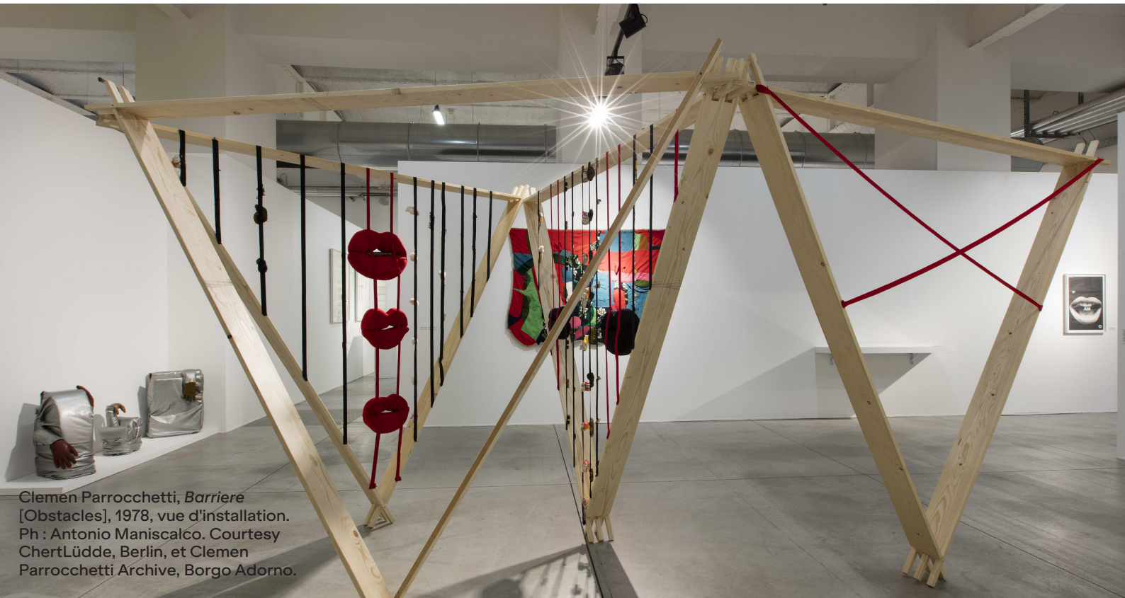
Clemén Parrocchetti, Barriere [Obstacles], 1978, vue d'installation.

Cette exposition thématique met en scène l'alphabet visuel, les rôles des femmes, la monstruosité et la dévoration dans le travail de l'artiste.