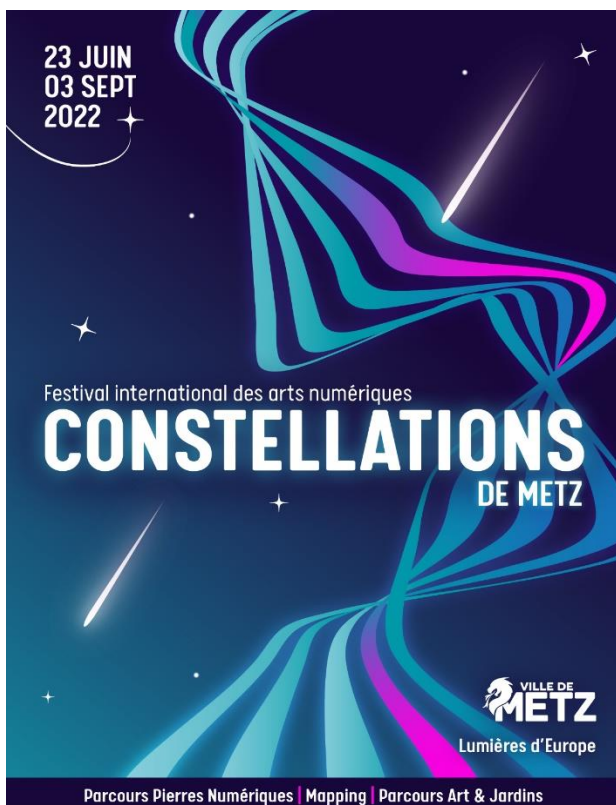
Affiche festival constellation de Metz 2022