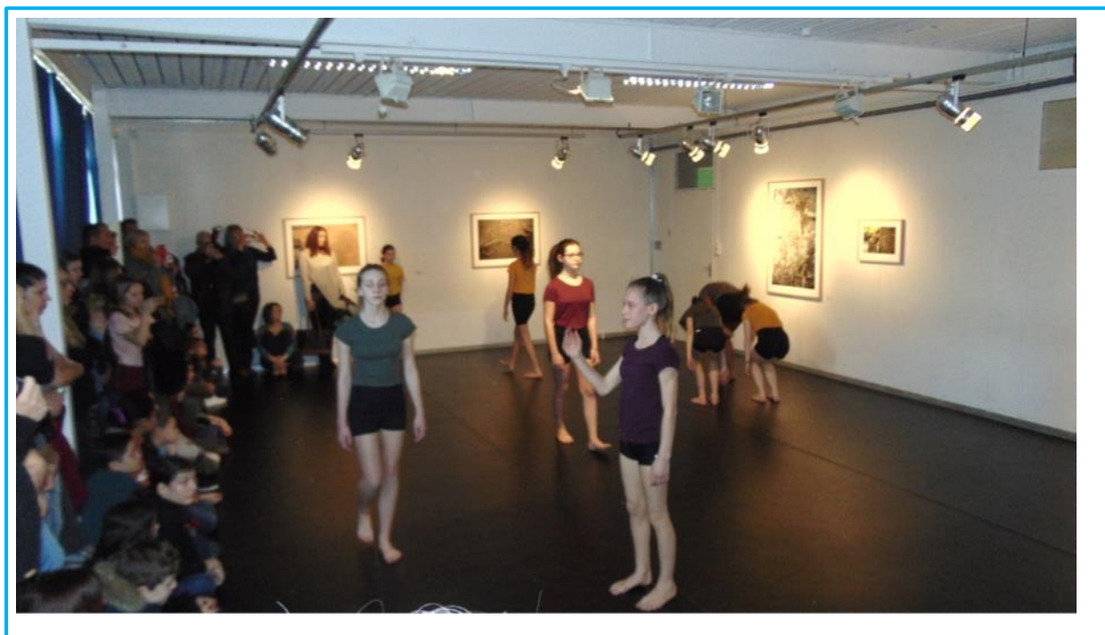
Détail d'exposition La langue verte des arbres , FRAC, 2018