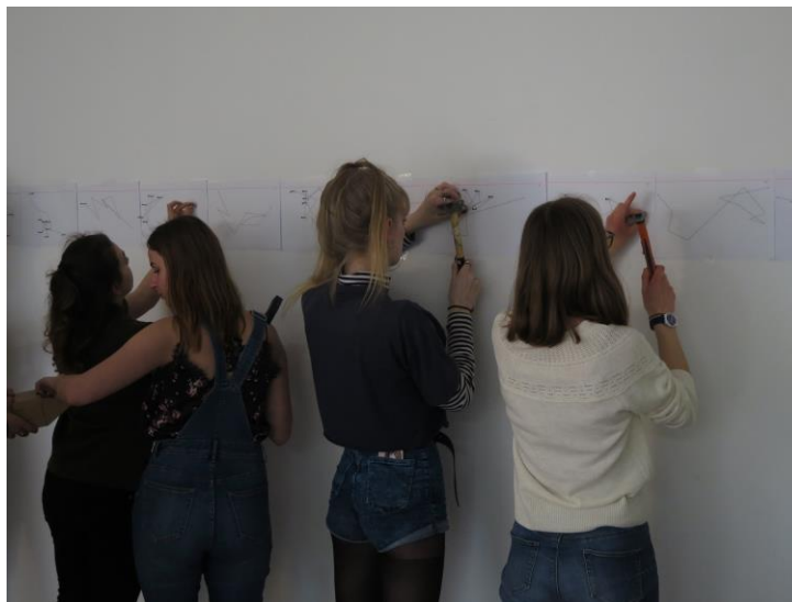
PROMENADE (PRESQUE) ALÉATOIRE , Vera Molnàr 1998-1999 Réactivation de la pièce par les élèves de Terminale, mars-avril 2019 Visuel : reportage sonore de l'installation par les élèves

https://sonnadiot.com/user/149197136/promenade-presque-aleatoire-de-vera-molnar-1998-1999