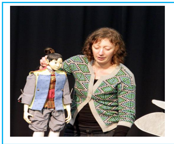
Spectacle vivant, Les bonheurs de Sacha par la compagnie le strapontin rouge , 2015