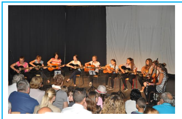
Spectacle de fin d'année alliant chant, musique, danse et théâtre, 2017