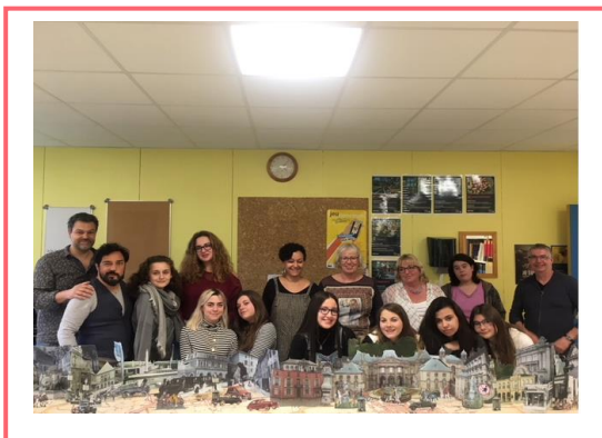
Elèves médiateurs de l'exposition FRAC Premier trimestre 2018-2019 sur la base du volontariat – Première Bac Professionnel Logistique