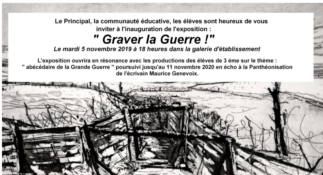
Graver la Guerre ! , carton d'invitation, 2019, 80 eaux-fortes originales de 1914 à 1920 en lien avec les productions d'élèves présentés dans le couloir d'entrée de l'établissement : abécédaire de la Grande Guerre .