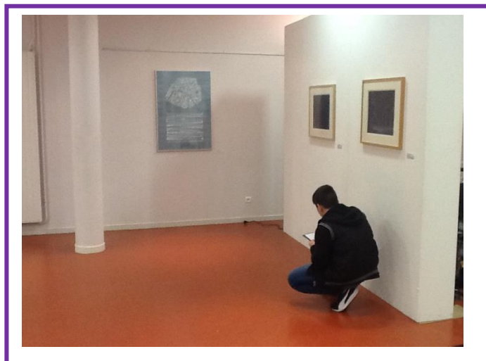
Penser la ville , Frac Lorraine, 2016