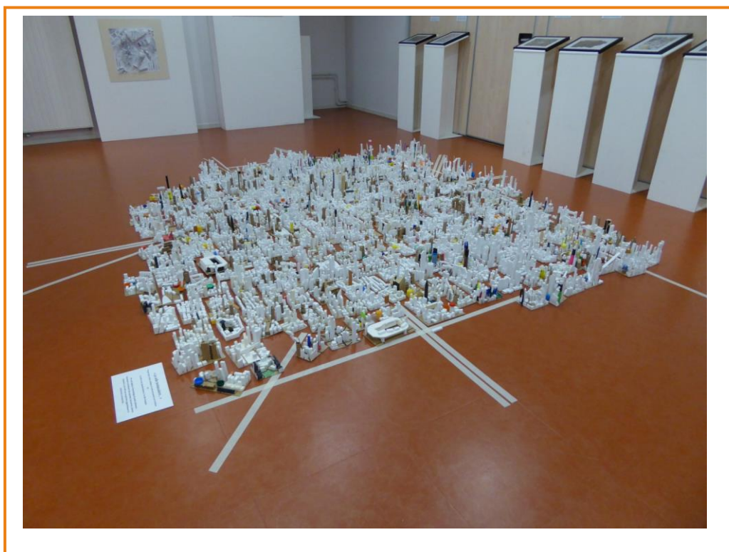
La ville , 2018, installation des classes de 3 ème , exposition finale des productions réalisées dans le cadre du PEAC