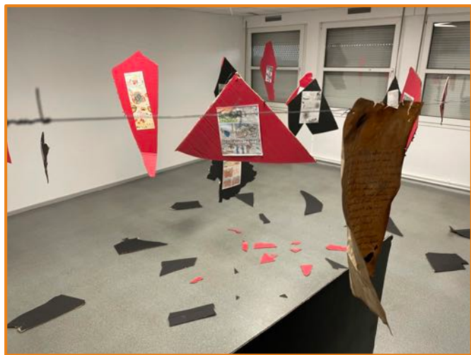
Exposition Vues des tranchées , décembre 2021 - mars 2022.

Nous souhaitons poursuivre le travail de collaboration avec les structures culturelles partenaires tout en nous engageons dans de nouveaux projets comme des résidences d'artistes.