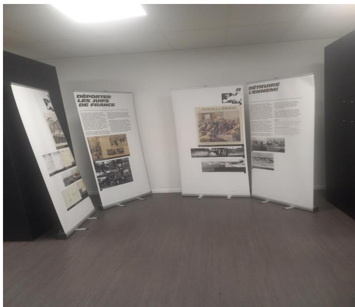
Exposition prêtée par le mémorial de la Shoah sur la déportation en France. Décembre 2023