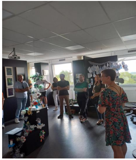
Vernissage de l'exposition Arborescences , 06-2023