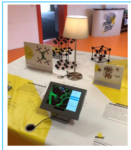
Bling-Bling, octobre 2023, exposition d'ouverture