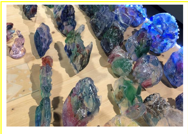
Paysages, projet cycle 3, juin 2023