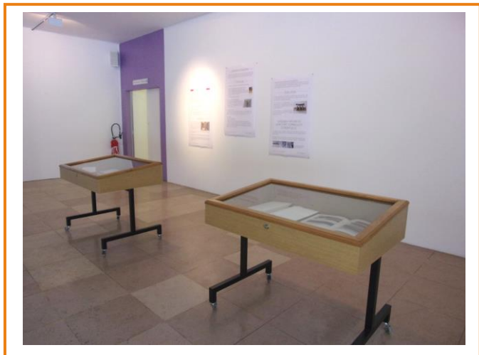
Livre(s), jeu de formes et de lectures, Exposition de la collection de livres d'artistes de la médiathèque de Forbach avec affiches de présentation. Du 17 Janvier au 28 Février 2019