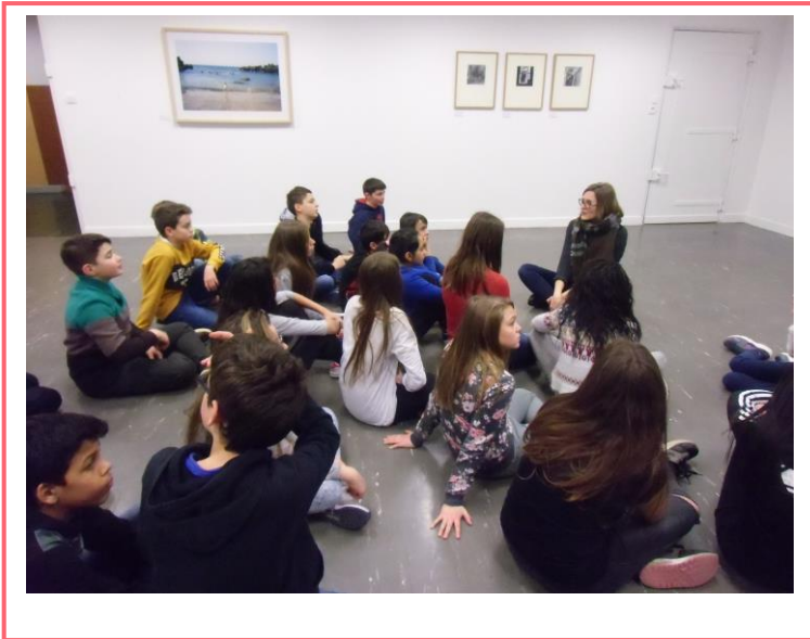
Exposition d'oeuvres du FRAC Lorraine, Il était un songe Mars 2016