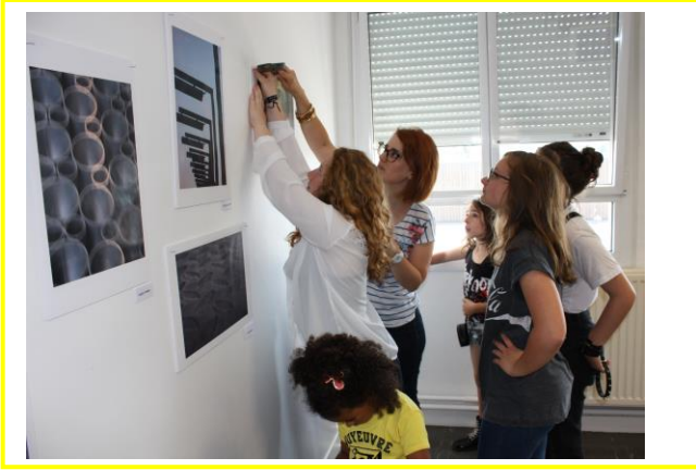
Exposition Mais, qu'est-ce ? En partenariat avec un étudiant de l'école des Beaux arts de Metz, Mai 2018