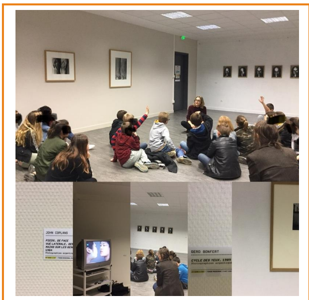
Exposition du FRAC lorrain : Vieux Monstre, je t'aime , 2017