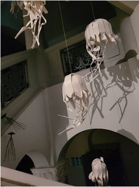
Exposition de Matthieu Dagorn. 2022 Jellyfish.

Sur le thème « Créer pour l'environnement ». Travail personnel de l'artiste qui est intervenu auprès des classes pour créer avec les élèves des monstres en plastiques.