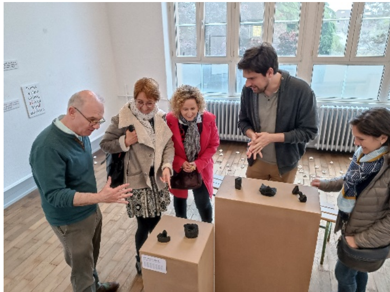
Exposition Anthony Visconti – 2023 – présentation aux enseignants

Le collège a demandé l'aménagement de plusieurs salles en vue d'une nouvelle répartition des salles en pôles disciplinaires dans l'établissement. Il serait intéressant de repenser la place de la salle d'exposition soit en la jouxtant au CDI afin de permettre aux élèves un accès libre, soit en la rapprochant des salles d'Arts Plastiques afin d'en faciliter l'accès et la mise en place d'exposition.