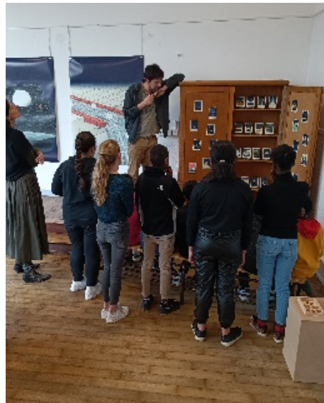
et aux élèves