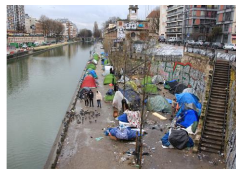
Photographies, sans titre, 2019

Abdul SABOOR sur le site du CCAM : https://www.centremalraux.com/saison/my-journey-to-europe