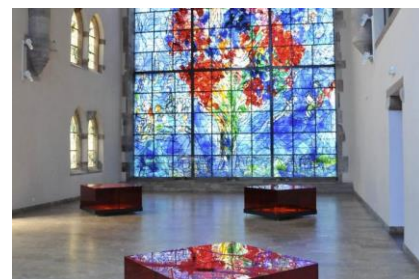
Chapelle des Cordeliers, Le vitrail « La Paix »

Pour découvrir le Musée, c'est par ici (Moselle Attractivité) : https://www.youtube.com/watch?v=Qnfr-l6ccTo