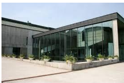
Musée du pays de Sarrebourg Marc Chagall