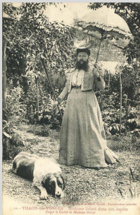
Arch. dép. Vosges, 4 Fi 465/29

Pense à partager ta production au ce.21emelac@ac-nancy-metz.fr