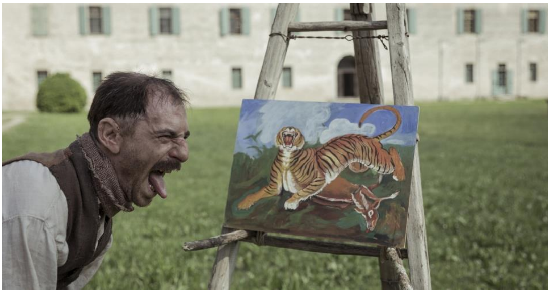
Je voulais me cacher film de Giorgio Diritti (2019) consacré à Antonio Ligabue

D'autres artistes ont dépassé leurs différences grâce à l'art : Van Gogh (1853-1890) souffrait d'une grande instabilité mentale. Frida Kahlo (1907-1954), malade de la poliomyélite , a été victime d'un accident : elle a subi de nombreuses opérations et souffert toute sa vie.