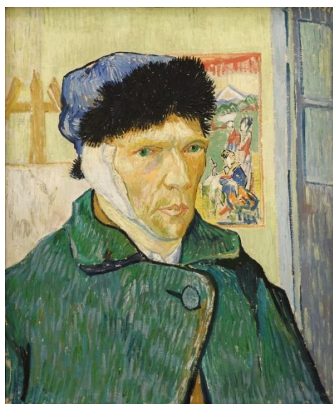
Autoportrait à l'oreille bandée (1889), par Van Gogh, huile sur toile (60 × 49 cm), Londres, Institut Courtauld, The Samuel Courtauld Trust (F527/JH1657)