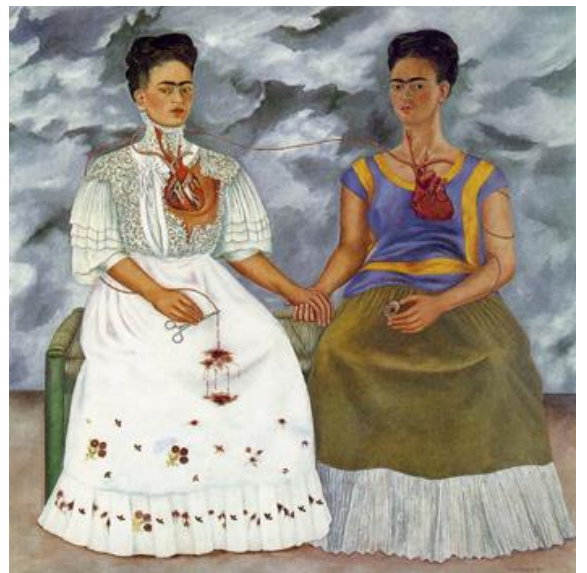
Los dos Frida (1939) par Frida Kahlo