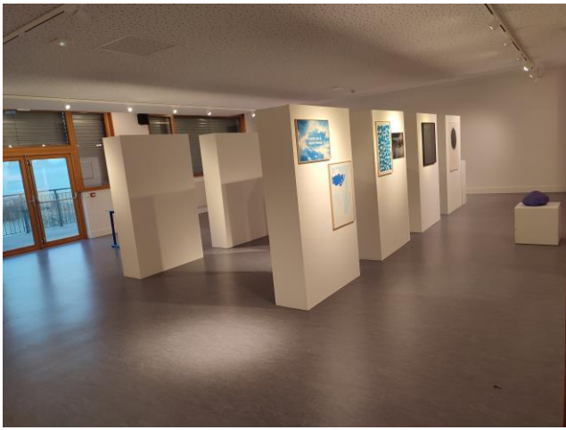
Exposition d'art contemporain : Un voyage dans l'univers , Association Plus vite, janvier 2022