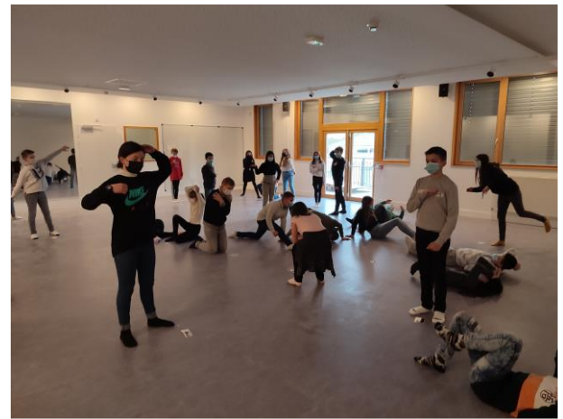
Séquence danse et sculpture dans le cadre du cours d'arts plastiques, février 2022