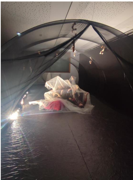
Atelier danse dans le cadre de la résidence d'artistes de la compagnie L'aéronef - CTEAC, Communauté de communes Mirecourt-Dompaire, mars-avril 2022