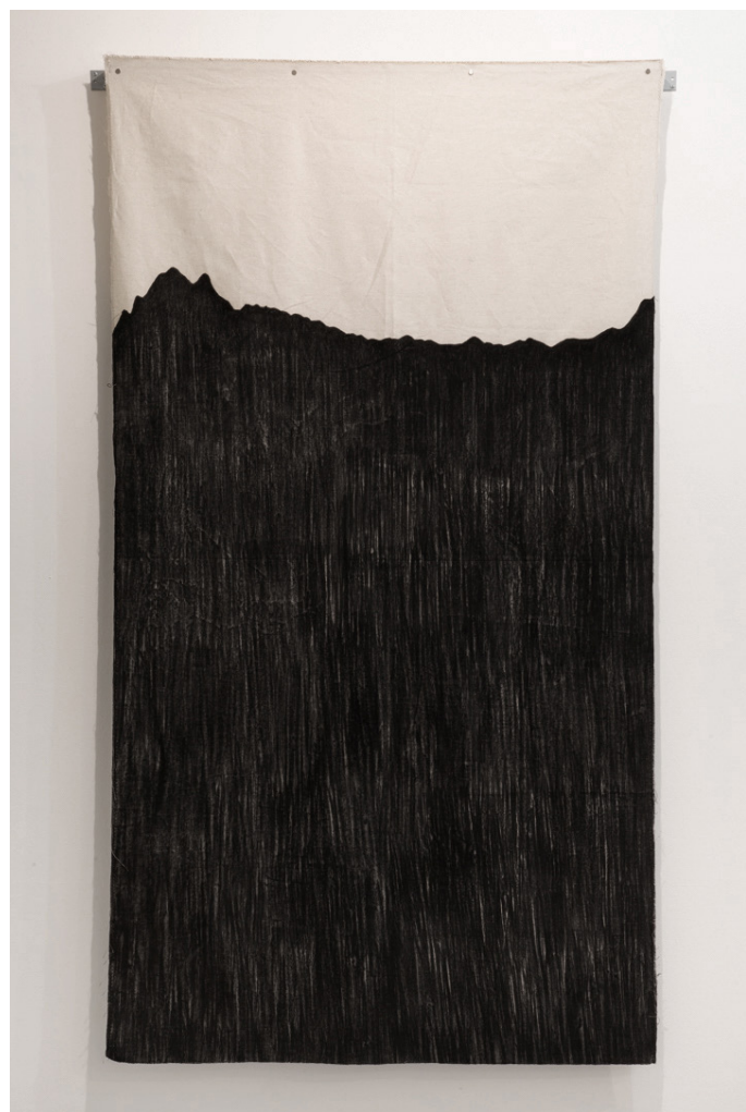
Cristina Escobar, Paysages de la mémoire , 2021, série de dessins, charbon sur tissu (Projet participatif)