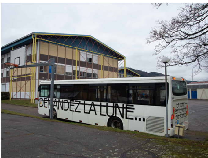
l'Art Bus au collège de Rupt-sur-Moselle, habillage extérieur réalisé par RERO, 2021.