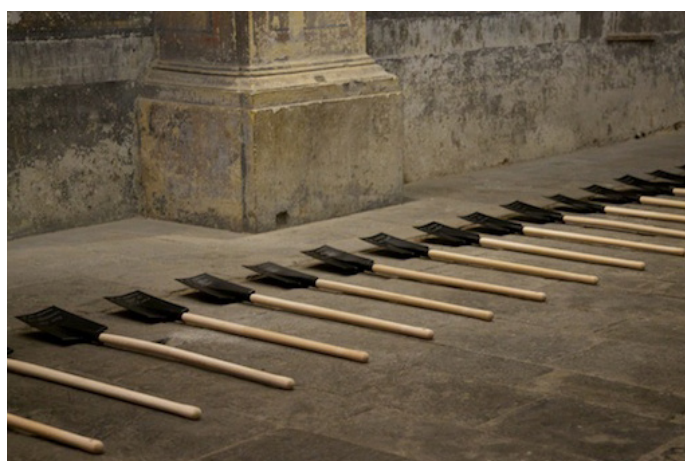
Cristina Escobar, Trous de mémoire #2 , 2012, installation linéaire de 9m environ, écriture sablée sur 20 pelles, métal, bois, dimension variable.