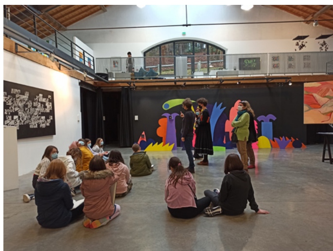
Visite de l'exposition Entre-temps , des étudiants de troisième année de l'ESAL - Epinal par les élèves de la classe CHAAP de Thaon-Les-Vosges, 2022.