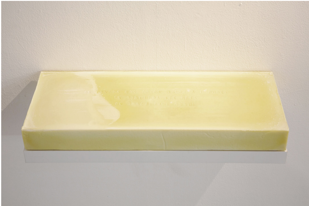
Cristina Escobar, L'oubli , 2021, écriture sur savon de 15 kg