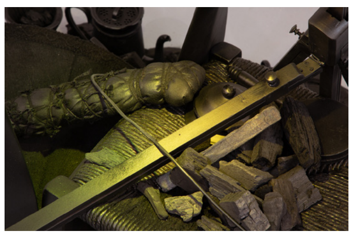
Cristina Escobar, L'ombre des choses , 2021 (commencement), objets variés vernis en noir, ampoule (Projet participatif)