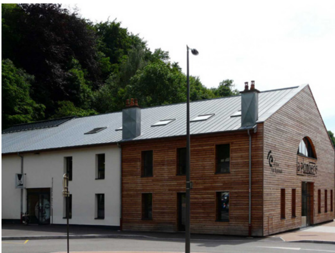
La Lune en Parachute, La Plomberie, 46B, rue Saint-Michel, 88000 EPINAL.

En parallèle de leurs expositions, l'association met en place depuis 14 ans, l'opération Art Bus, une exposition itinérante sur le territoire vosgien renouvelée chaque année et destinée aux collégiens du territoire vosgien.